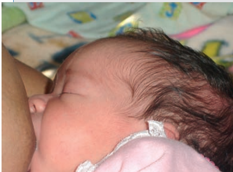
Destaque para o atendimento da maternidade do HGP

Os pacientes receberam o formulário da pesquisa pelo correio, depois do tratamento a que se submeteram, e puderam responder gratuitamente pela internet, carta-resposta ou por telefone. Para a classificação das maternidades também foram incluídas perguntas específicas sobre humanização do parto.