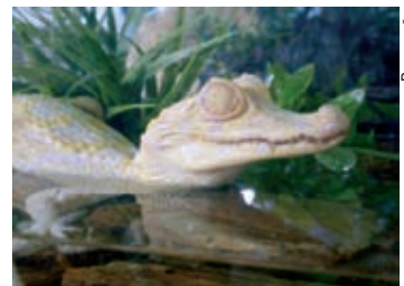
Jacaré albino é uma das principais atrações no Aquário de São Paulo

Endereço: Rua Huet Bacelar, 407 - Ipiranga - São Paulo/SP (Próximo ao Metrô Ipiranga) - Tel: (11) 2273.5500. Horário: De segunda a domingo, das 9h às 18h. Ingressos: R$20,00 (passaporte único), R$10,00 para idosos, a partir de 60 anos (Portadores de deficiência física são isentos) e para os dias de segunda-feira, R$60,00 (visitas noturnas).