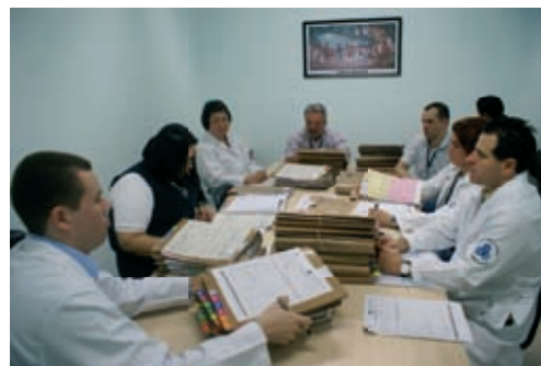
CRO durante reunião