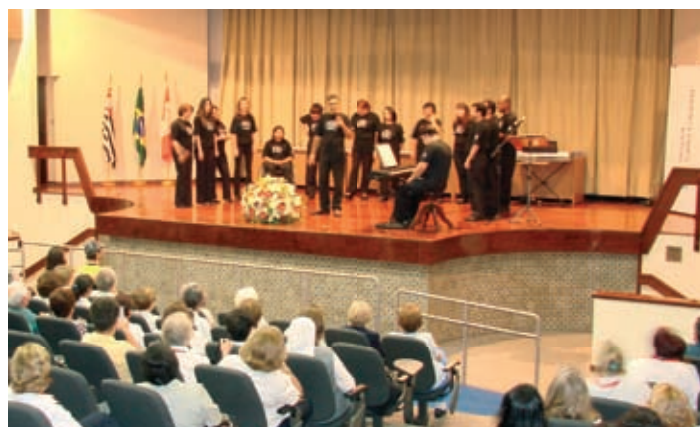
Coralistas do HGP durante apresentação

O Coral Brincar de Cantar do HGP fez bonito no “V HospCoral” que aconteceu no dia 30 de outubro no Teatro Santa Catarina do Hospital de Santa Catarina (HSC). O encontro anual promove o intercâmbio entre os coros de hospitais de São Paulo. O repertório do HGP reuniu as canções: Resposta, Nunca Pare de Sonhar e Brincar de Viver.