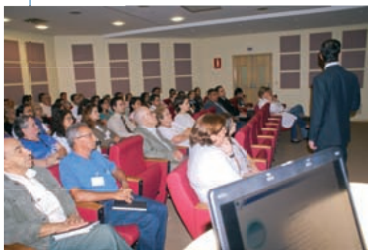
“I Encontro Estratégico para o Futuro”

O evento contou com o patrocínio da Cooperativa de Economia Mútuo dos Funcionários da Associação Congregação de Santa Catarina e do Espaço Gastronômico Ancona (Rua Guaraiúva, 542, Brooklin, telefone: 5505-4281), além da participação do grupo Amigos do Trabalhador e auditores internos que apoiaram o evento.